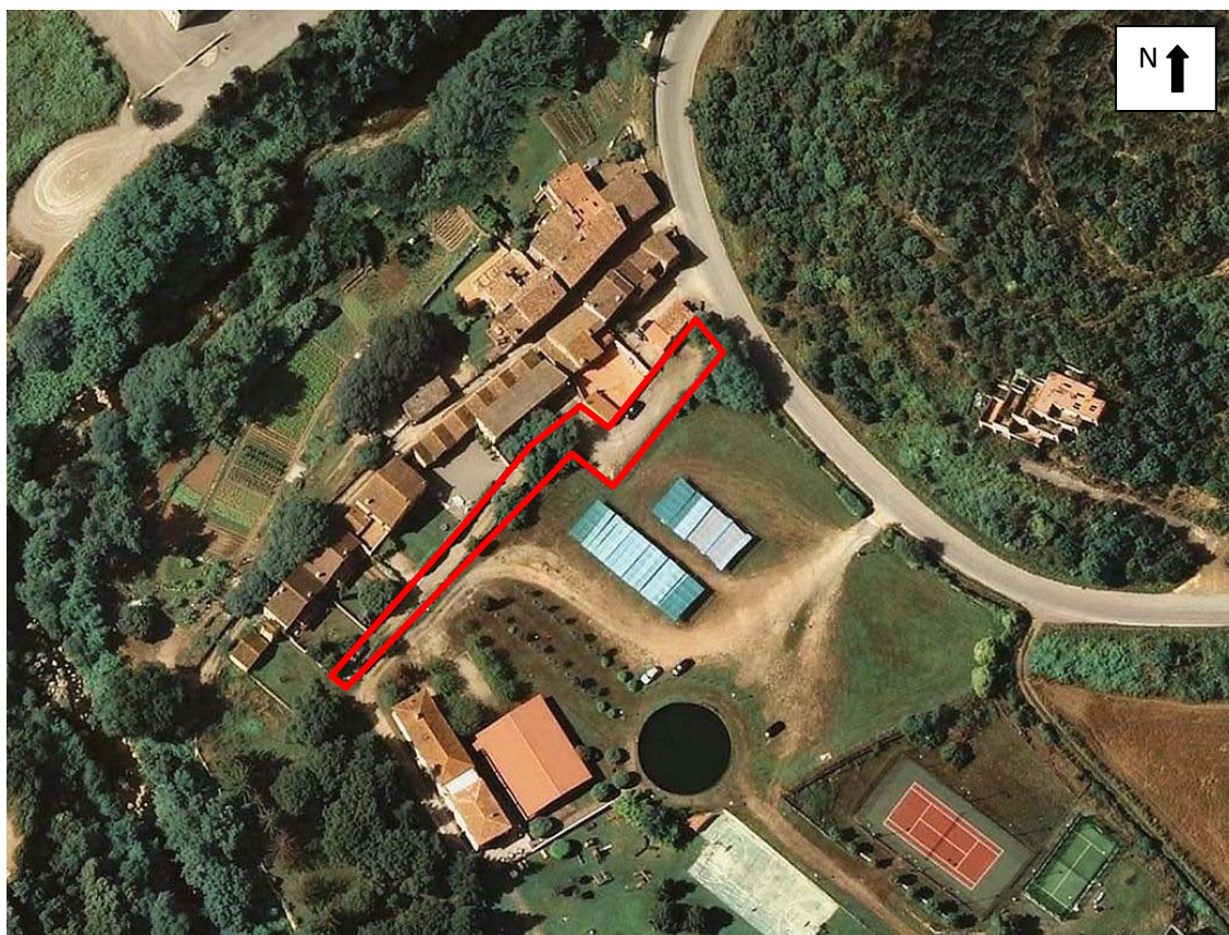
Imatge superior: situació del carrer de Gallicant dins el Barri de Gallicant.

A simple vista es poden veure dos carrers paral·lels i després l'entrada al Casino del Figueró.