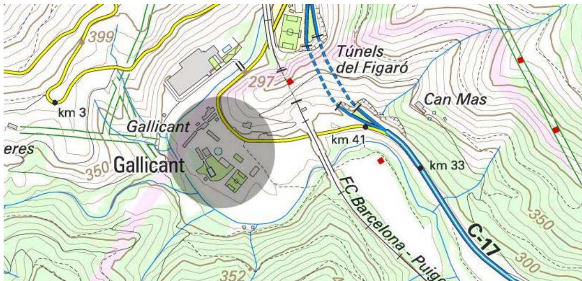
Imatge superior: situació del barri de Gallicant dins el T.M de la Garriga, ubicat en la part nord. S'hi accedeix des de la C-17.