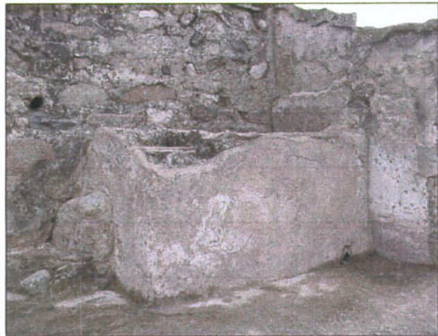
Dipòsit: Bd 1

Una altra de les accions portades a terme fou la neteja de les parets que presentaven taques de fongs i concrecions calcàries. Les parets netejades van ser: B3, Bd 1 i Bd 2, així com l'interior de la piscina freda.