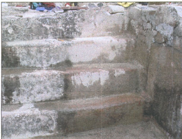
Frigidarium: graons, C3